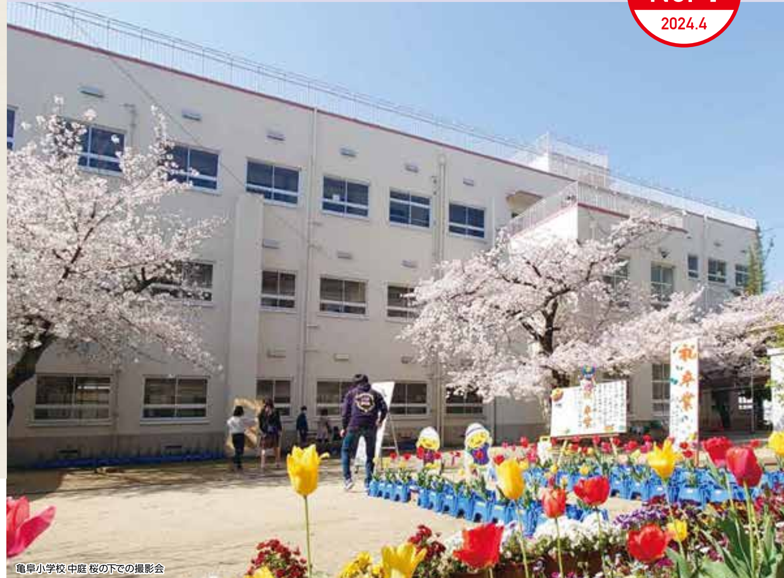
亀阜小学校 中庭 桜の下での撮影会